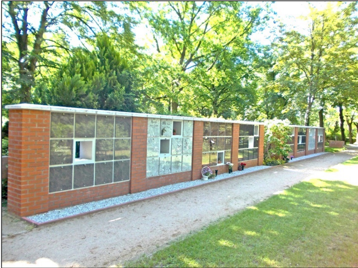
Beispielbilder - Verfügbarkeit unter Vorbehalt