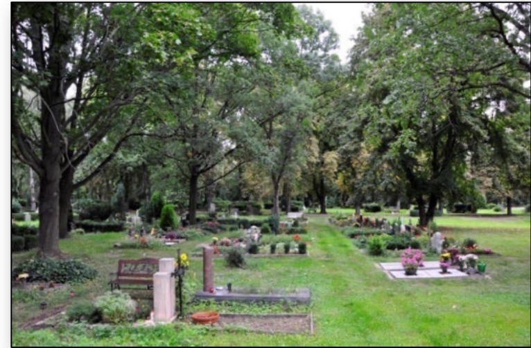
Beispielbilder - Verfügbarkeit unter Vorbehalt

Diese Abteilungen werden durch die Mitarbeiter des Friedhofs gepflegt. Reihengrabstätten mit Steineinfassung sind von den Nutzungsberechtigten zu pflegen und in Ordnung zu halten.