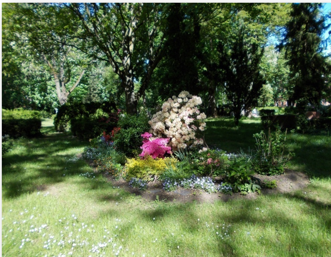
Beispielbilder - Verfügbarkeit unter Vorbehalt