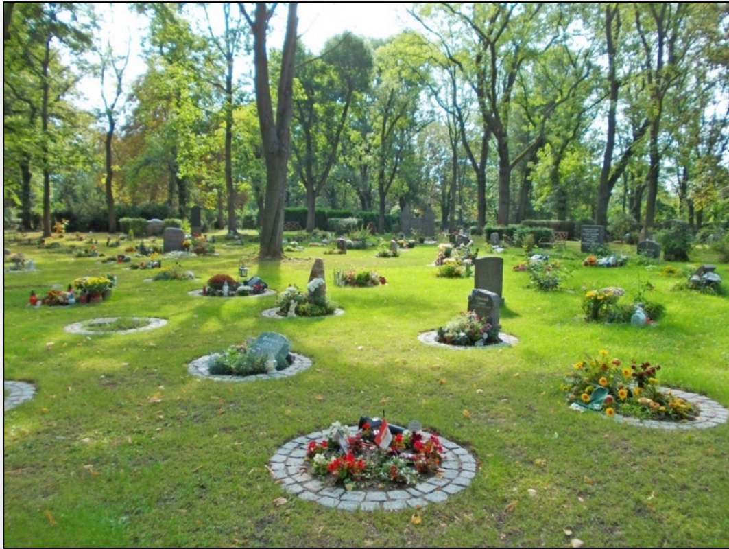
Beispielbilder - Verfügbarkeit unter Vorbehalt