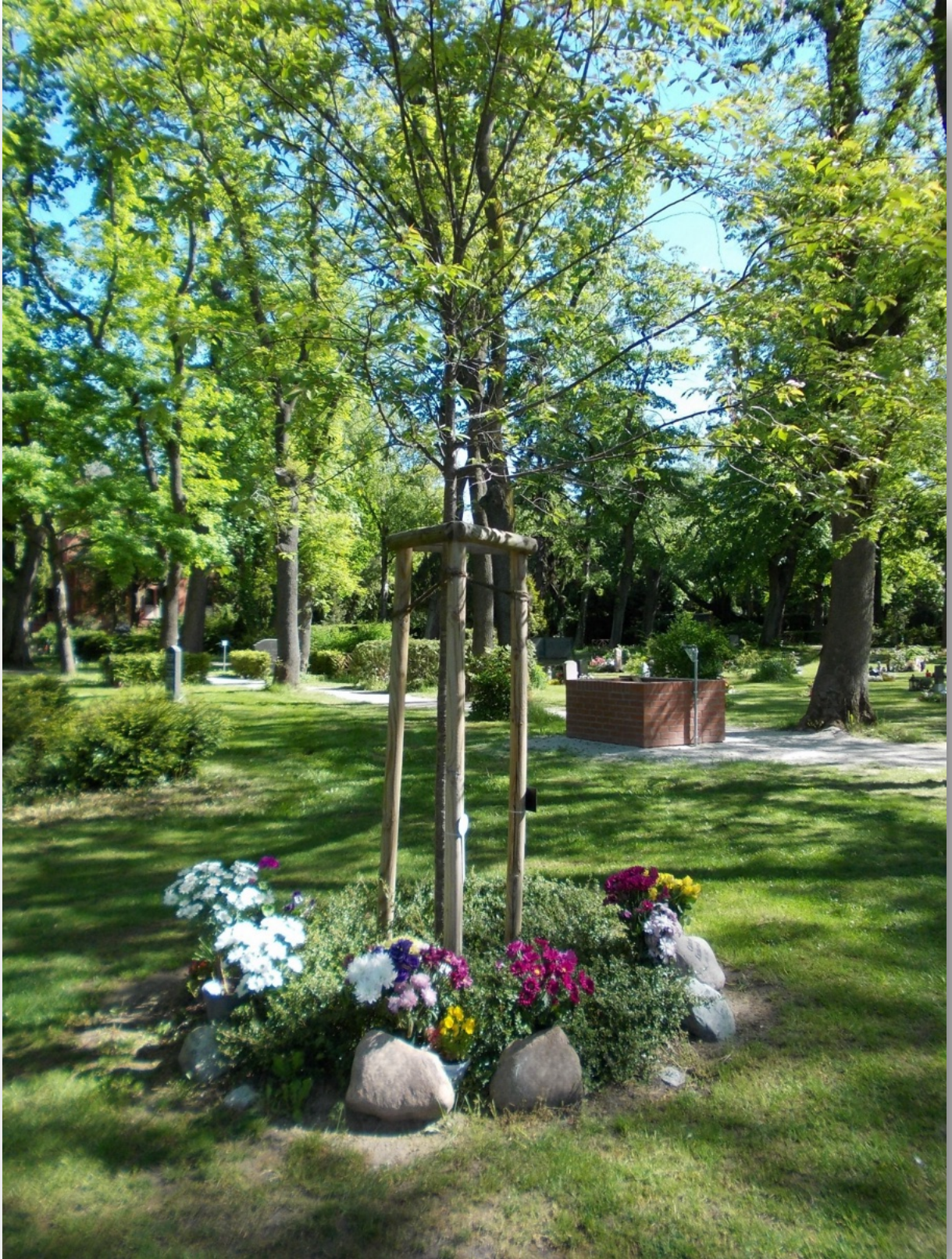
Beispielbilder - Verfügbarkeit unter Vorbehalt