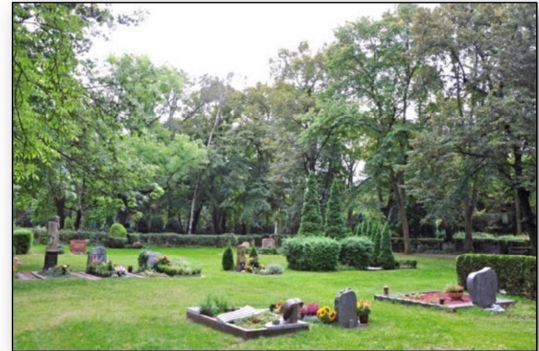
Beispielbilder - Verfügbarkeit unter Vorbehalt

Außerdem bieten wir Wahlgrabstellen an, auf der Sie nur einen liegenden oder stehenden Grabstein im Rasen setzen lassen müssen, ohne Umrandung und ohne erforderliche Grabpflege.