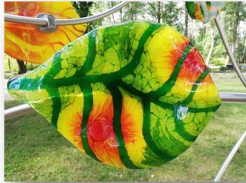
Beispielbilder - Verfügbarkeit unter Vorbe-