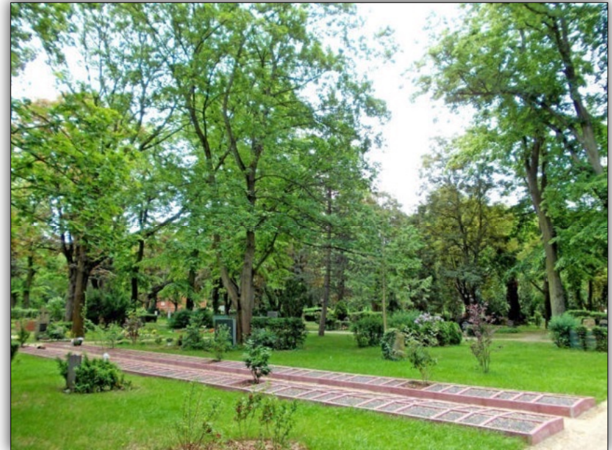
Beispielbilder - Verfügbarkeit unter Vorbehalt

Die Anlagen werden durch die Mitarbeiter des Friedhofs gepflegt.