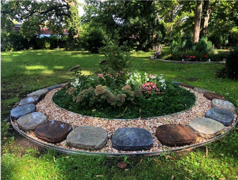
Beispielbilder - Verfügbarkeit unter Vorbehalt